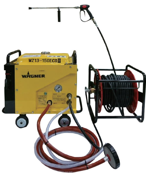
標準セット P/N 2294230