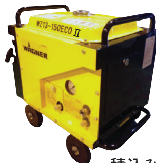
積込み・積降ろしに便利な 取っ手を標準装備